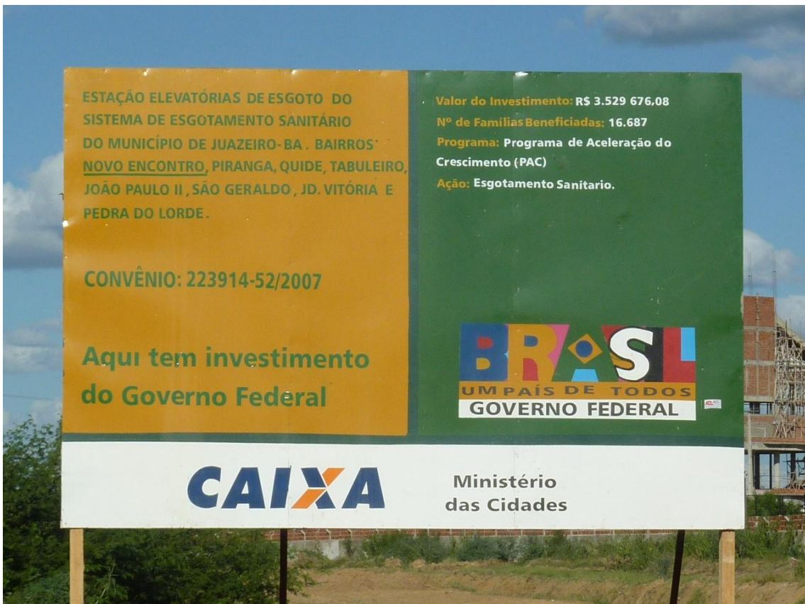
4. Placa de propaganda onde deve ser construída uma das estações elevatórias. Até o momento, nada além da placa.