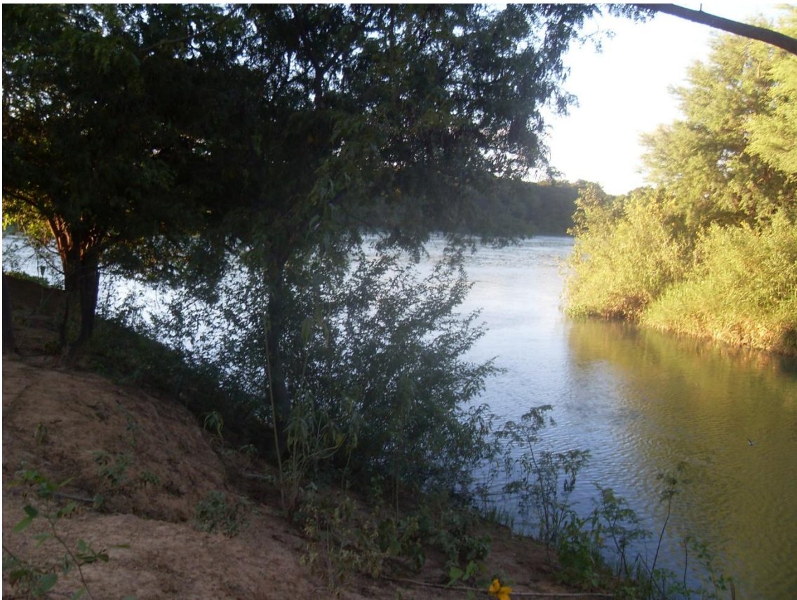
8. Despejo do esgoto sem tratamento nas águas do rio São Francisco. Logo abaixo, várias comunidades ribeirinhas utilizam essa água in natura .