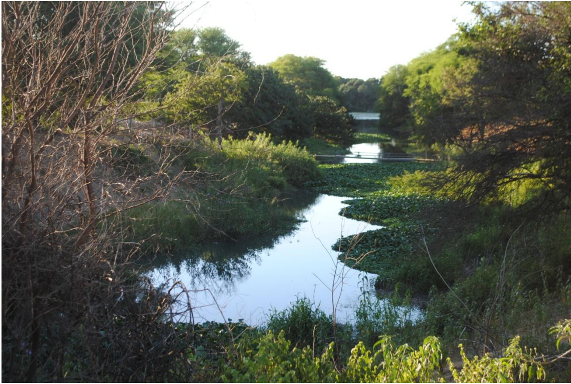
7. Canal de aproximação do esgoto sem tratamento com o rio São Francisco