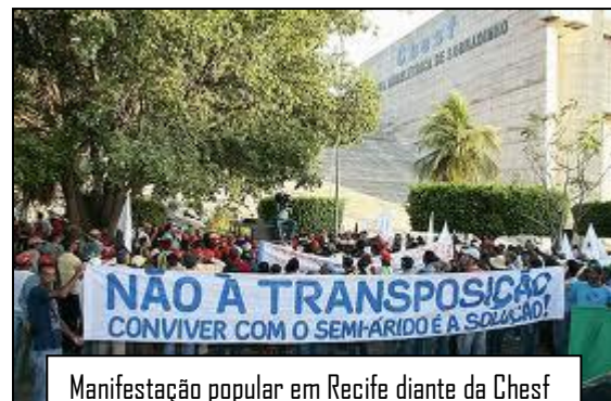
Manifestação popular em Recife diante da Chesf

Ao cabo, podemos reafirmar que ao PRSF falta precisão conceitual , pois visa remediar e não combater as causas da degradação, não melhora os principais aspectos dos ecossistemas implicados. Como está a reboque da transposição , fica condicionado e submisso aos interesses por trás deste projeto prioritário. Não parte de um diagnóstico amplo e profundo da bacia e não propõe um Zoneamento Econômico e Ecológico realista e responsável. O enfoque centrado em esgotamento sanitário urbano desconsidera as outras causas de degradação e perde efetividade em relação à carga total de poluição, oriunda também de outras atividades de exploração. As obras de desassoreamento e contenção de erosão das margens são ações experimentais voltadas para a hidrovía , que