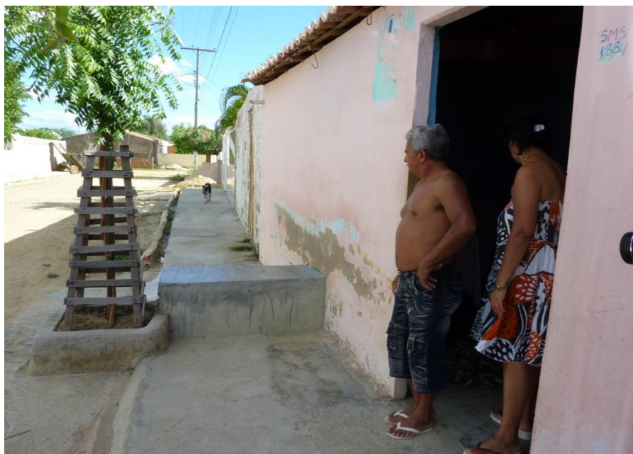
1. Residência no bairro do Quidé ligada à rede pública de esgoto (início do Caminho do Esgoto)