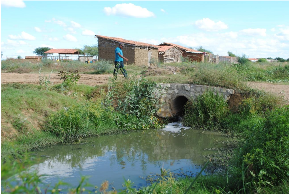
3. Canal construído ao lado de um loteamento irregular.