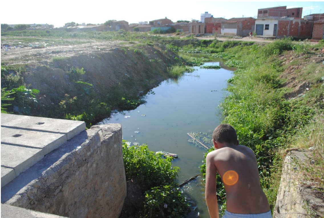
6. Principal canal de coleta do esgoto da cidade cortando vários bairros