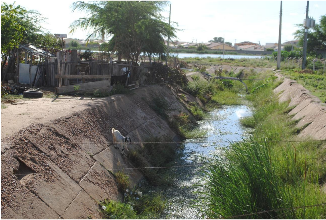
5. Canal de coleta passando ao lado de uma estação de tratamento