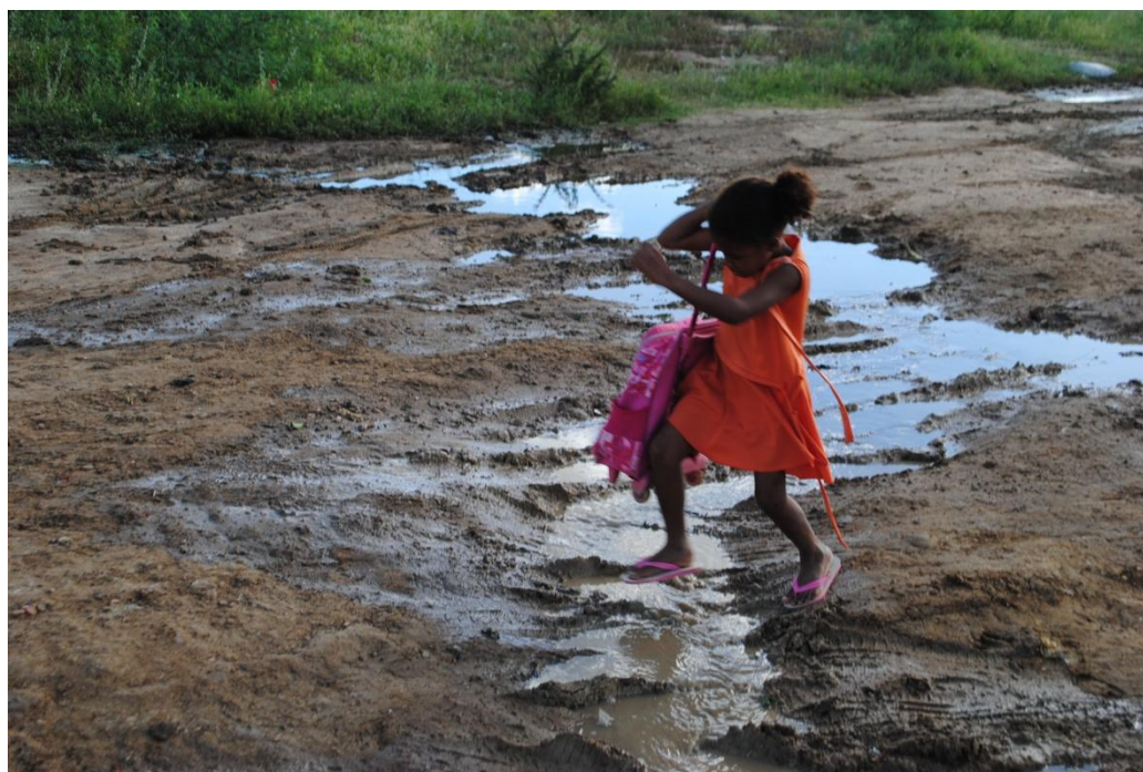
2. Esgoto a céu aberto, próximo ao bairro do Quidé, colocando em risco a saúde das pessoas.